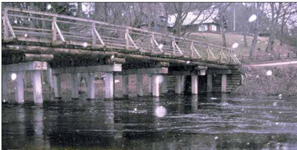
Šio Zervynų tilto Ūla jau neįveiks