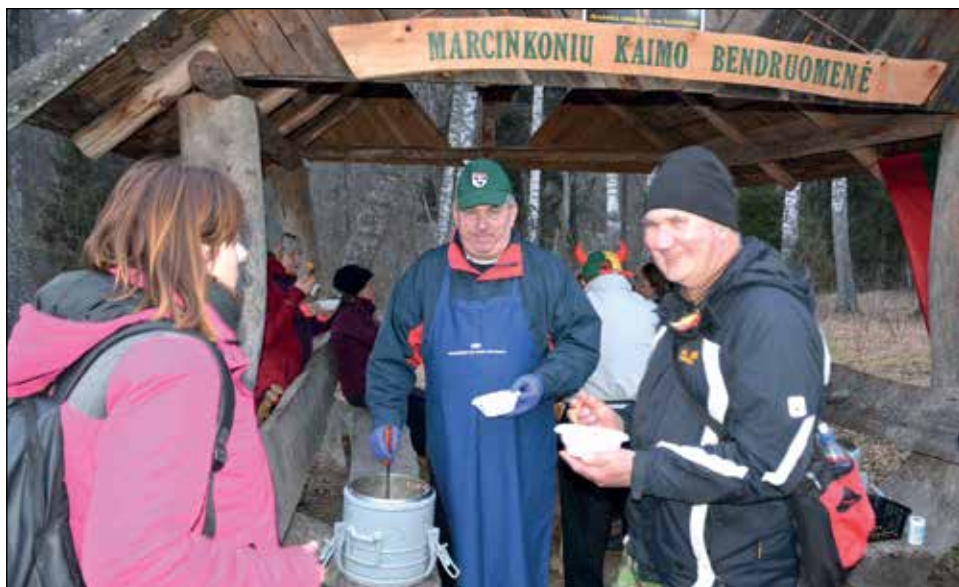
Žygeiviai buvo pavaišinti Marcinkonių bendruomenės narių virta grikių koše ir arbata