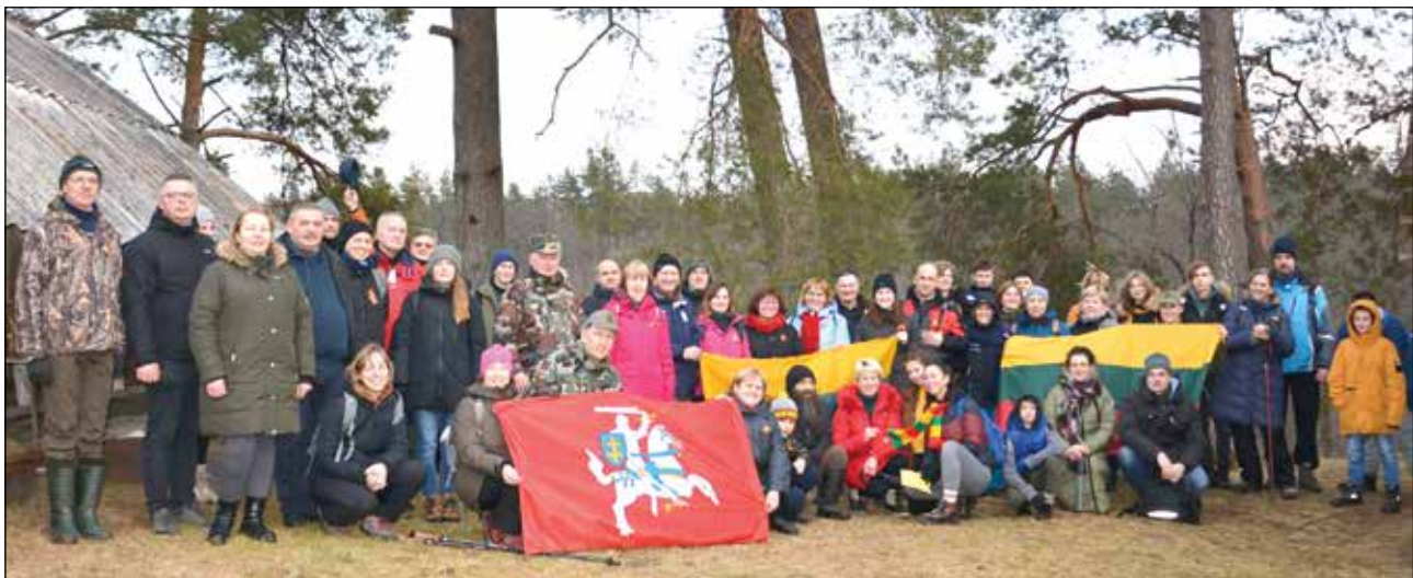
Žygio dalyviai Kasčiūnuose, Jakavonių sodyboje, prie Kazimieraičio ir Vanago vadavietės