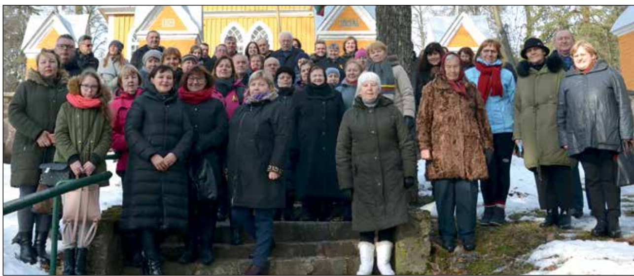
Žygio dalyviai po šv. Mišių prie Marcinkonių bažnyčios