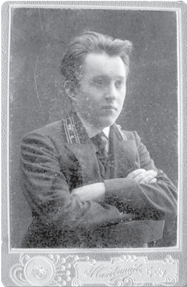
Baku realinės mokyklos mokytojas Vincas Krėvė su valstybės tarnautojo - kolegijos asesoriaus uniforma. 1910 metai, Baku

Azerbaidžano rašytojų sąjungos mėnraščio „Azerbaidžan“ 2020 metų sausio numeryje išspausdinta lietuvių ir azerbaidžaniečių literatūrinių bei kultūrinių ryšių tyrinėtojo, publicisto ir vertėjo Mahiro Gamzajevio naujausia dokumentinės lituanistikos tyrimų krypties apybraiža apie lietuvių literatūros klasiko Vinco Krėvės gyvenimo ir veiklos Baku laikotarpį (1909-1920 m.)