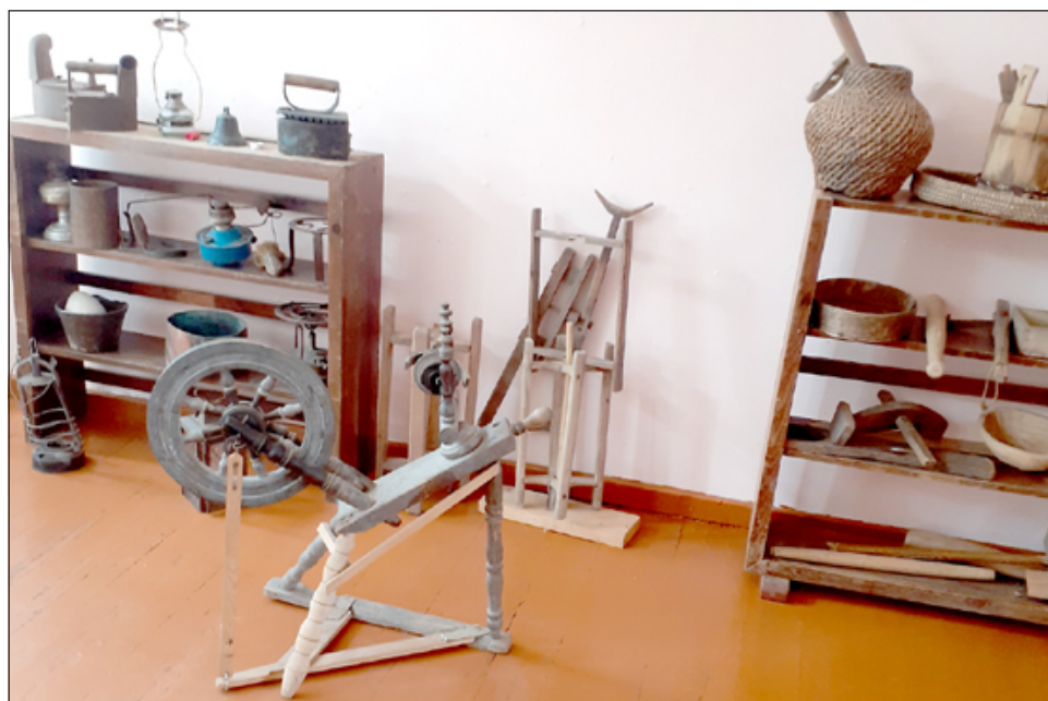
Nedzingiškų senoviniai buitiniai rakandai