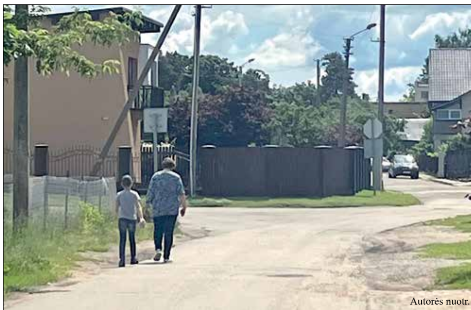
Varėnos Gedimino ir Pušyno gatvių sankryža

Varėnos Pušyno, Dainavos ir Gedimino gatvių gyventojai jau nebegali apsikęsti pro šalį lakstančių automobilių, kurie visiškai nepaiso greitį ribojančių ženklų, o prieš kurį laiką automobilis esą net įvažiavo į vieno gyventojų kiemą su visais vartais; tad tas pats nukentėjęs varėniškis ir paprašė „Merkio krašto“ išsiaiškinti – kaip pažaboti tokius kelių erelius?..