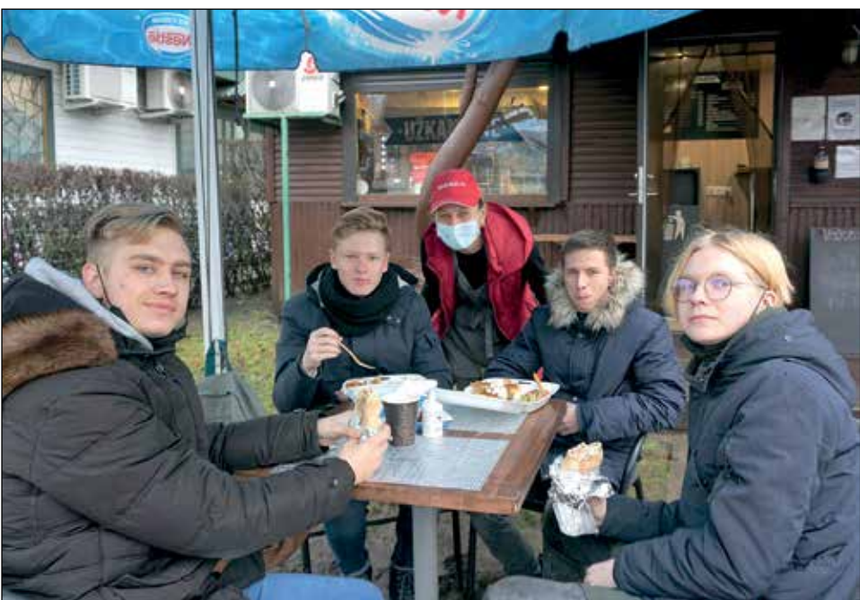
Gal mieliausi klientai – vaikai

Algimantas ČERNIAUSKAS