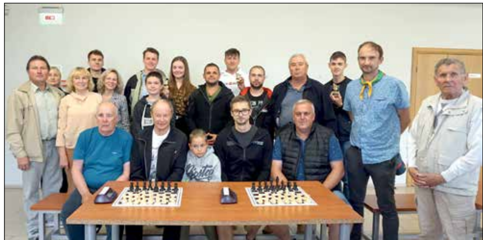
Šachmatų turnyro dalyviai, teisėjai ir sirgaliai