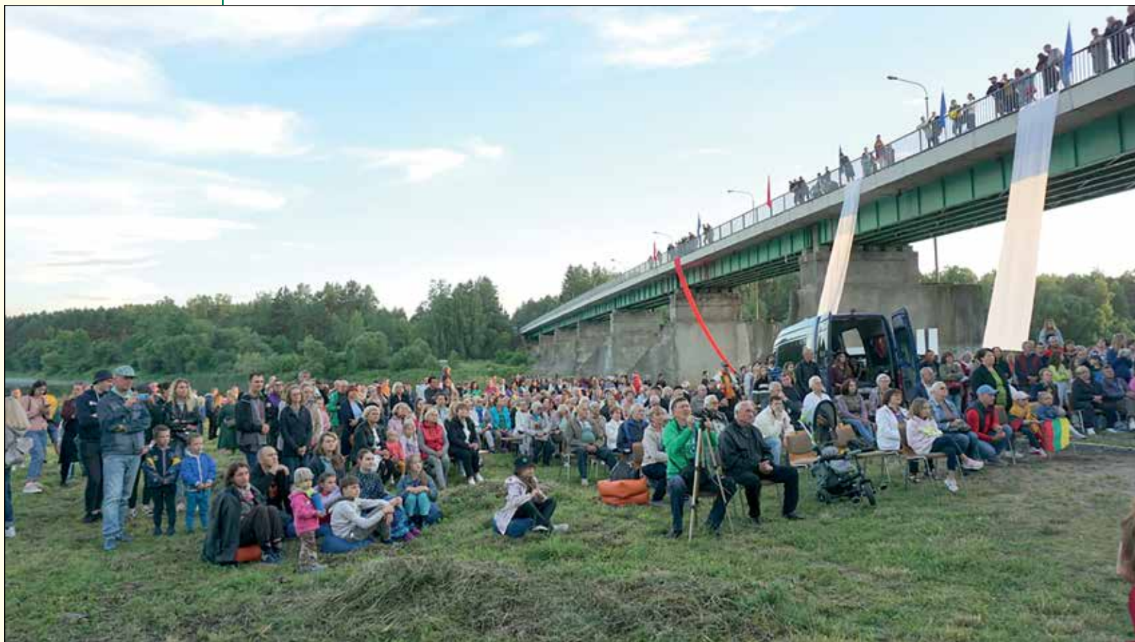
Kas netilpo santakoje, himną giedojo ir šventę stebėjo nuo tilto, papuošto istorinėmis Lietuvos ir Merkinės vėliavomis