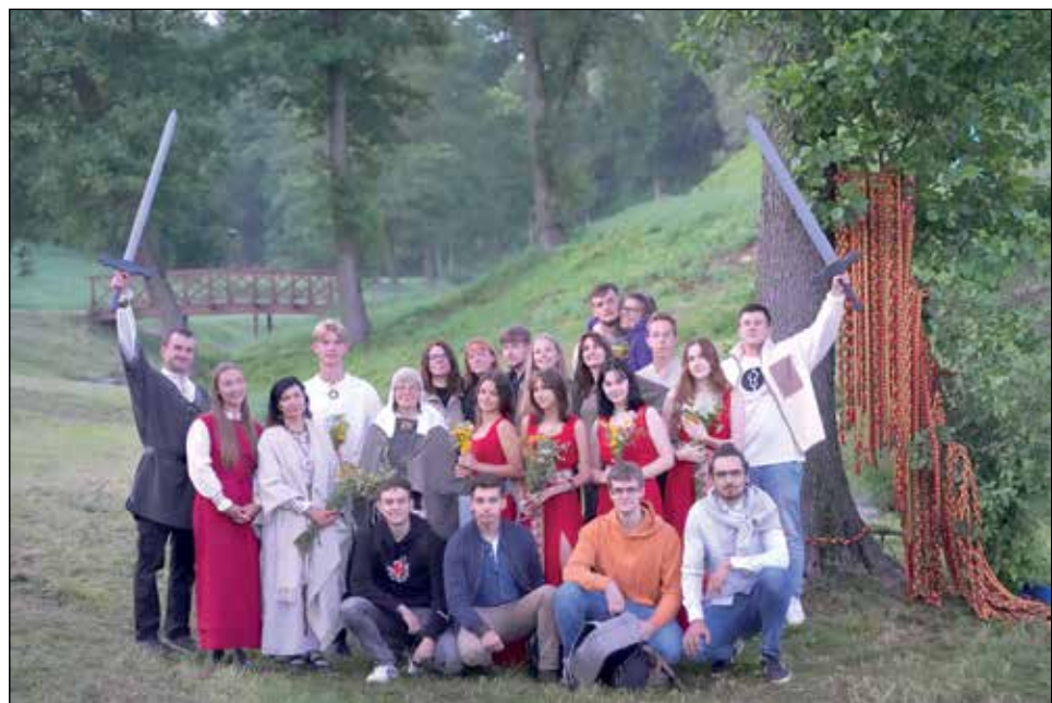
Nuotrauka atminčiai lyg pasižadėjimas būsimiems darbams ir bendriems projektams. Liepos 10 d. programa „Milžinkapis“ buvo parodyta Veisiejuose, o ketvirtadienį muzikinę inscenizaciją pamatys Druskininkai

zikinės inscenizacijos premjera „Milžinkapis“ pagal Vinco Krėvės epą.