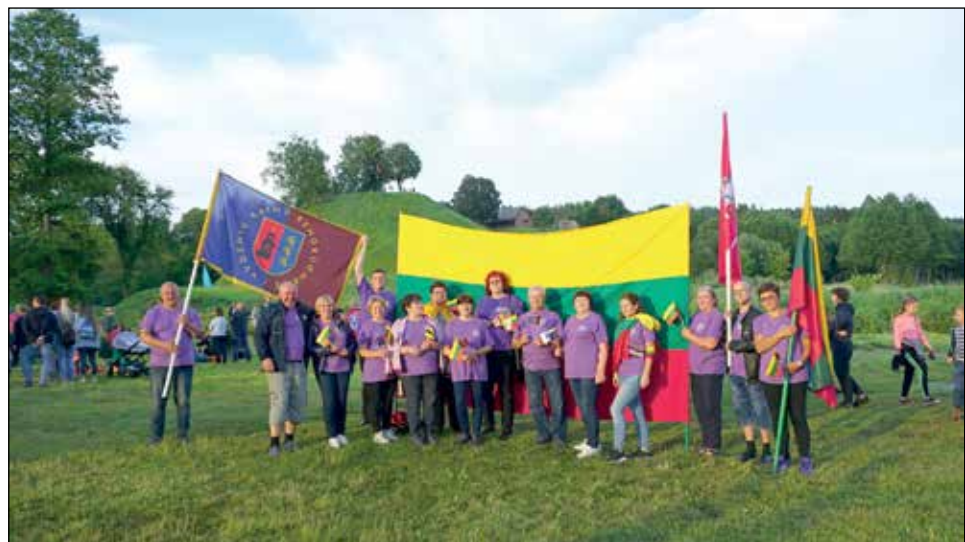
Kaip visada puošni ir pasitempusi šaunioji Vydenių kaimo bendruomenė