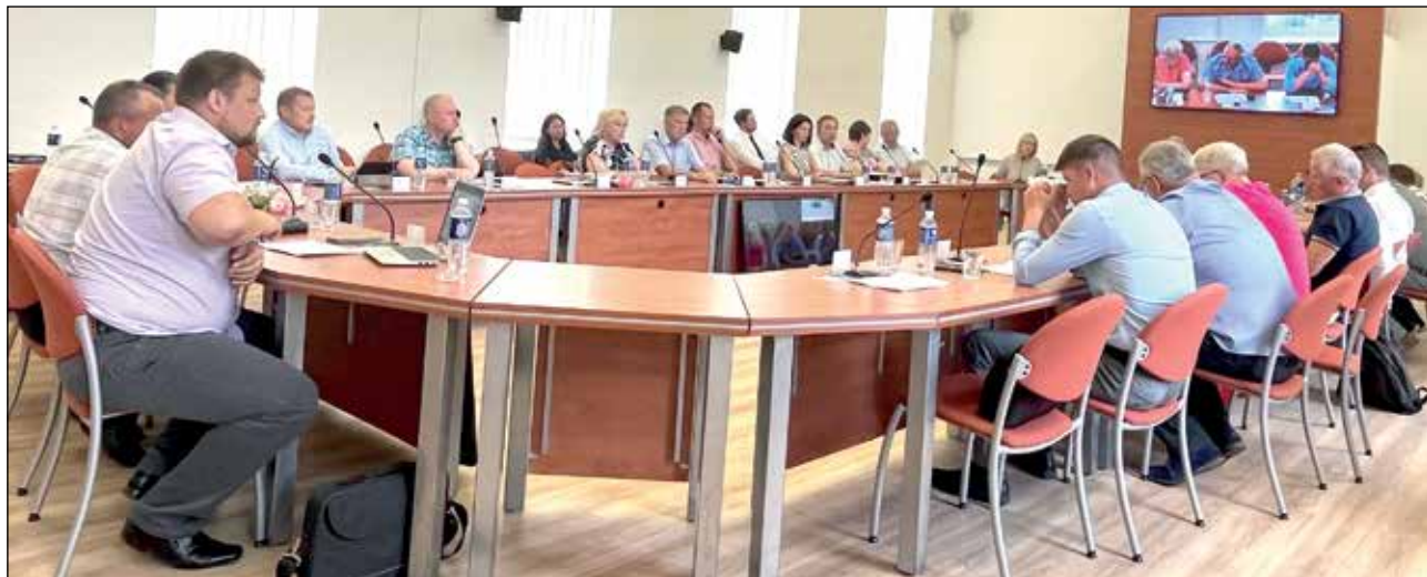
Rajono tarybos posėdyje