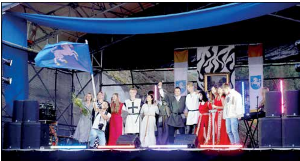
Finalinė „Milžinkapio“ scena. Inscenizacija buvo skirta 140-osioms V. Krėvės gimimo metinėms