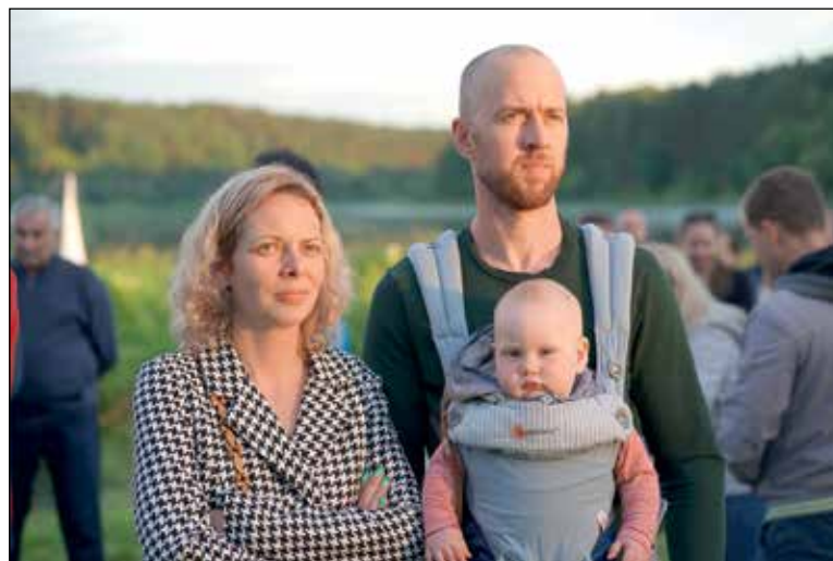
Akimirka iš šventės

Algimantas ČERNIAUSKAS