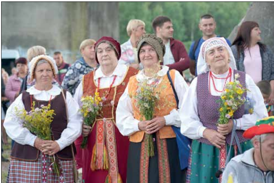
Merkinės kultūros centro folkloro ansamblio „Kukalis“ moterys po savo pasirodymo himną giedoja su visais šventės dalyviais