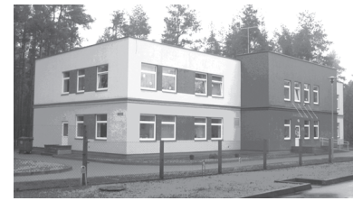
2009 m. vasario 13 d. duris atvėrė Varėnos socialinių paslaugų centras. (Averkienė R. Socialiai pažeidžiamiausiems – jauki užuovėja. – Iliustr. // Savivaldybių žinios. – 2009, vas. 19, p. 10-11)

2010 m. vasario 23 d. „Ažuolo“ vidurinė mokykla tapo „Ažuolo“ gimnazija.